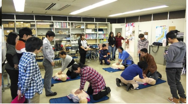
↑ 心肺蘇生法の訓練