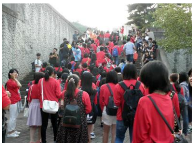
Kuha ng mga Kabataan ng Fukushima ng bumisita sa Kolehiyo ng Korea probinsya ng Cheonju