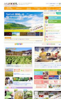
「Fukushima Shinhatsubai」 HP ( http://www.new-fukushima.jp/ )

Inumpisahan ngayong taon ng taglagas, Ang Fukushima Shinhatsubai: Towards a new future of Fukushima website ay matatagpuan sa website ng Prepektura ng Fukushima ito ay naghahandog ng impormasyon para sa monitoring sa radioactive materials sa iba't-ibang wika kasama na ang ingles. Ang mga impormasyon para sa resulta ng pag iinspeksyon ng radioactive materials na nakuha sa produkto ng agricultura at mangingisda na gawa at huli sa Fukushima ay ibabalita sa madla. Sa wikang Hapon at Ingles at may wikang Italyano, Intsik, Koreano din .Ang mga mamamayan ay bibigyan ng karapatang tingnan ang mga nakatala sa bawat kalakal buhat sa iba't-ibang industriya na magiging eksklusibo sa araw na anihin o hulihin, kung saan galing, ay may mapa na nakahanda para alamin ang lugar. Ang adhikain nito ay ipaalam ang tunay at tapat na impormasyon at pag iinspeksyon na ginagawa dito sa Fukushima para sa buong mundo ma dayuhan man o sariling mamamayan.