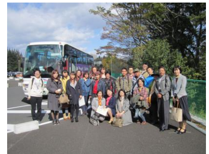
Mga nagsidalo ng Study Tour

Noong Oktobre 25, (linggo) isinagawa ng Pandaigdigang Asosasyon ng Fukushima ang Study Tour sa lunsod ng Sendai. Ang mga naninirahang dayuhan sa iba't-ibang distrito ng Miyagi na puno ng kanya kanyang komunidad na may dalawanpung katao ang nagsidalo. Sa bandang umaga ay bumisita sa ginaganap na festival 「Sendai Earth Festival」 sa Sendai Kokusai Center. Inobserbahan ang mga booths at stage performances ng mga dayuhan pati ang pagpapakilala sa mga aktibidadis na gaganapin at ginamitan ng display panel. Sa bandang hapon naman ay nakinig sa panayam ng dalawang dayuhang naninirahan sa prepektura ng Miyagi kung papaano itaguyod ang samahan ng isang grupo. Tinig buhat sa mga nagsidalo ay marami silang natutunan sa pag bisita sa iba't- ibang grupo maliban sa lugar na kanilang kinlalagyan at ng mapanuod ang mga aktibidadis na isinasagawa dito.