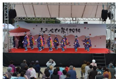
Kuha ng mga kabataan ng Minami-Soma na nagtanghal ng “Karasuzaki kodomo teodori”

Noong Oktobre 4(Sabado) at 5 (Linggo) ang 「Fiesta para sa bayang kinalakhan 2014」 ay ginanap sa lunsod ng Fukushima Shiki no Sato. Na may layuning mapatatag ang pagkakaisa ng mga mamamayan sa prefektura ng Fukushima na ang gobyerno ang siyang punong abala para sa na nasabing ebento. Kinatatampukan ng mga etnikong tagapaghanghal sa buong lugar ng prefektura .Dinaluhan ng 20 pangkay para mag tanghal sa sa banggit na festival.