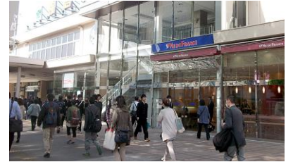
福岛车站前步履匆匆的上班上学乘客。(福岛市 2011.5.9 拍摄)

东日本大地震已过去2个多月了,辽阔的福岛县大地也开始呈现出了各种新的姿态。恢复了日常生活的福岛市、因在第一核电站20-30公里圈内,居民们以及町政府办公机能转移到了他乡异地顽强地开始新生活的大熊町、双叶町等6个町村、遭受巨大海啸的毁灭性的损害却已经渐渐开始重建家园的相马、因核电站事故的影响,至今难于开展重建工作的南相马市、最近新被令避难的饭馆村、因受核泄漏问题之嫌观光游客数锐减的会津若松市。因核污染问题的毫无根据的嫌疑所造成的损害,并不局限于观光地区的会津,还波及了全县,使情况呈现复杂化的趋势。