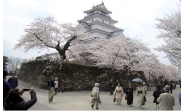
游客络绎不绝的鹤城 (会津若松市 2011.4.26 拍摄)