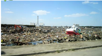
在海啸中遭受重创的相马港1号码头附近 (相马市 2011.4.12 拍摄)