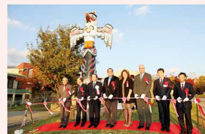
トーテムポール寄贈式典