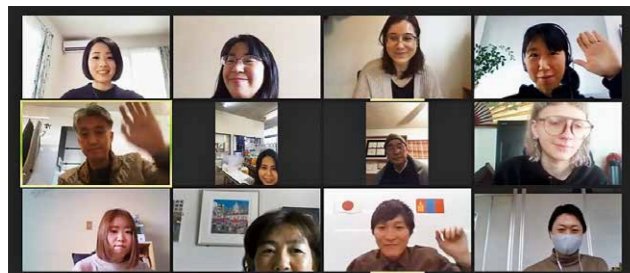
English Communication Courseはオンラインでも開催中！

国際交流員や外国出身者が講師となり、テーマに沿った英会話を楽しむ“English Communication Course”、外国人が母国の文化や言語を紹介する“グローバルコミュニケーションコース”、多言語で子どもたちに絵本を読む“GC Café for Kids”（福島県立図書館共催）の3つのコースを実施します。