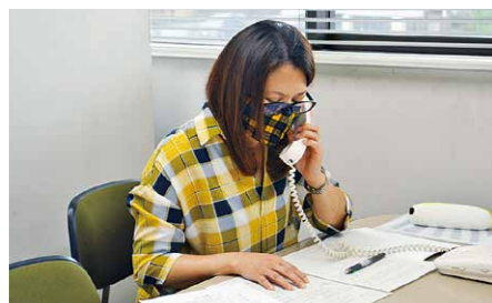
弁護士や行政書士と相談者の間で、通訳者が言葉の橋渡しを行います。

生活に関する法律相談、出入国・在留資格、国籍などの手続きの相談に無料で応じます。相談は1人1回まで。福島県に住む外国人とその家族が対象です。申し込みを受付してから相談日時を設定します。