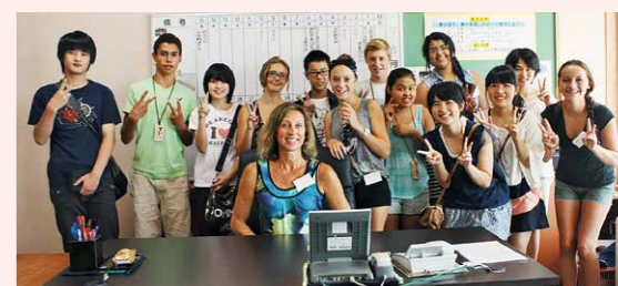
オリバー市の中学生を受け入れる磐梯町国際教育交流事業

2001年のうつくしま未来博でカナダ館に展示したトーテムポールは、磐梯町に寄贈され、現在は国際交流のシンボルとして磐梯町中央公民館前に設置しています。