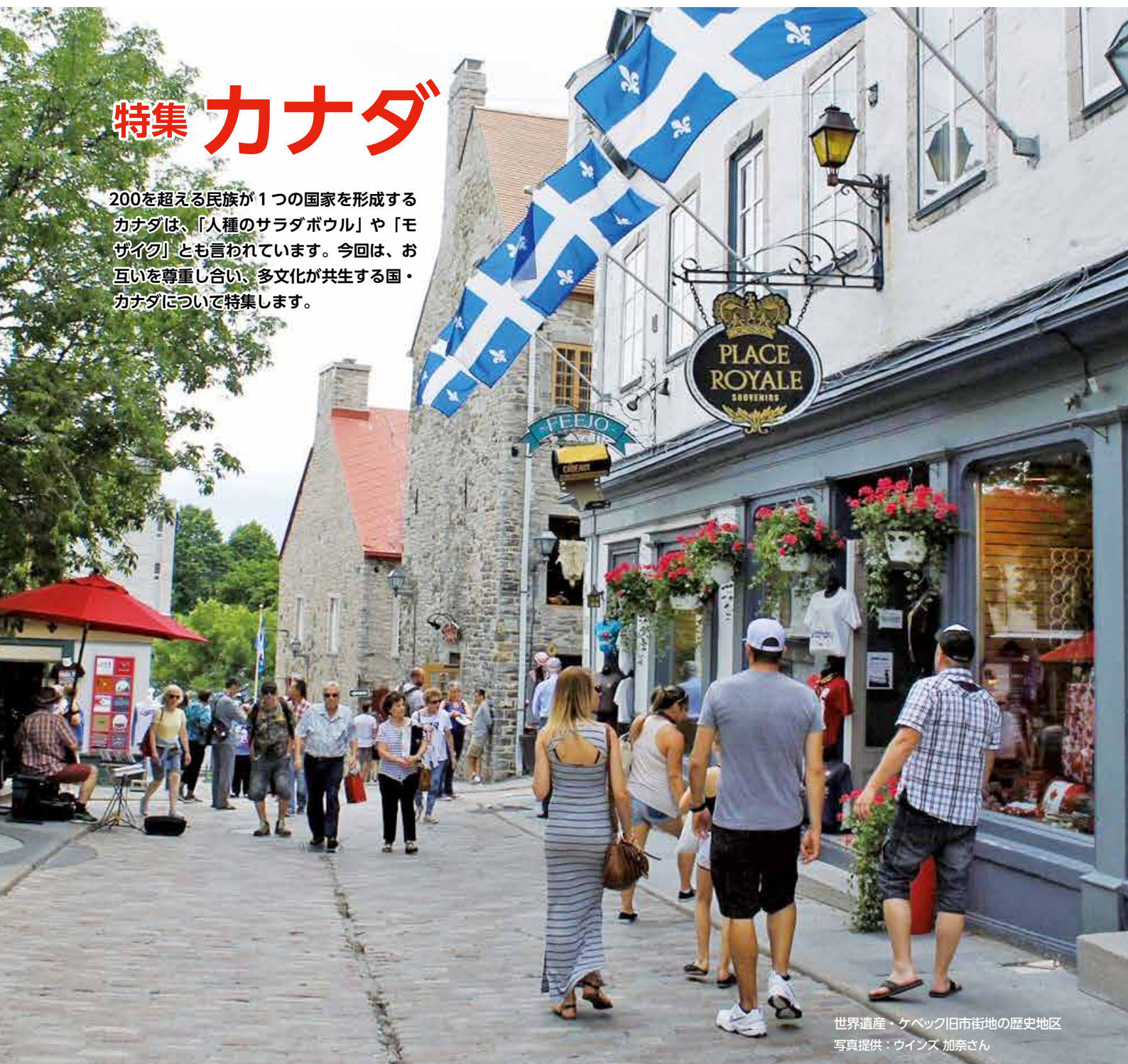
世界遺産・ケベック旧市街地の歴史地区

200を超える民族が1つの国家を形成するカナダは、「人種のサラダボウル」や「モザイク」とも言われています。今回は、お互いを尊重し合い、多文化が共生する国・カナダについて特集します。