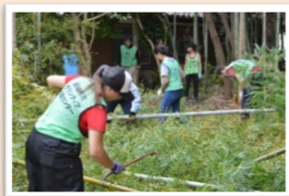
用电锯将竹子砍倒、将枝叶除掉后再砍成50厘米的长度