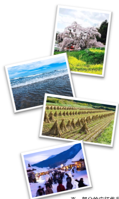
※一部分的应征作品 感谢大家众多的应征作品!