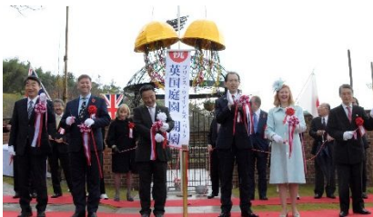
▲ Opening Celebration tape cut ng bisita ng dalawang bansa Hapon at Britanya

Ang park kung saan ang Prince William ng Britanya ay bumisita na pinangalanang 「England Garden」 ay nag open na may kahilingang makabangon ang Fukushima. Noong Nobyembre 4 (Sabado) ay ginanap ang opening ceremony kung saan si Madden Ambassador at Lady Borwick Former British Member of Parliament at marami pang ibang mga opisyal ng Japanese • British ang dumalo upang mamalasan pag-uumpisa ng magiging tulay ng pag-kakaibigan ng dalawang