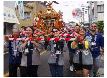
▲ Ang mga sumali sa pag bubuhat ng mikoshi.

Noong buwan ng Oktubre ika-pito (7), ang mga dayuhan ay nag buhat ng mikoshi, sponsored ng lizaka rotary club 「Ang ika-dalampu' t pitong (27th) beses Ang • Feista sa lizaka 」 na isinabay sa ginaganap na lizaka Kenka Festival. Kahit na umaambon ay marami pa ring ALT at international students na umabot sa 90 katao ang nagsidalo. Nang matapos nakatanggap ang mga sumali ng bindisyon para sa paglilinis sa Hachiman Shrine, ay binuhat ang mikoshi at inilibot sa bayan ng lizaka. Matapos ng pag bubuhat ng mikoshi ay naligo ang mga partisipante sa Yoshikawayaya isa sa mga hot spring sa Inabara Hot Spring. Ang naging impresyon ang mga sumali ay ang sumusunod 「napakagandang iksperyensya ang makaranas ng tradisyonal na kultura ng bansang Hapon」 「ang mikoshi pala ay mabigat」