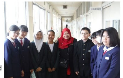
▲ Ang mga estudyante ng Inanamu Secondary School at mga estudyante ng Nakajima Junior High School

「Kikyofestival」 ay ginanap ang welcome ceremony, nag palabas ng slide show ng Malaysia field trip ng mga estudyante at ang masayang panunuod ng pag papalabas ng Koto