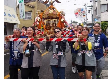
▲미코시를 메고 있는 참가자들

10 월 7 일, 외국출신자들이 神輿(미코시:신을 모신 가마)를 메는 이이자와 로타리클럽 주최 「제 27 회 더·마츠리 in 이이자와」가 이이자와 켄카마츠리와 함께 열렸습니다. 가랑비가 내리는 날씨에도 불구하고 현 내 각지에서 유학생들과 ALT 등 총 90 명이 모였습니다. 참가자는 하치만진자에서 불제를 올린 후 미코시를 메고 시내를 순회했습니다. 그 후, 아나바라운천 요시카와야에서 온천을 즐기며 몸을 따뜻하게 녹였습니다. 참가자들은 “일본의 전통문화를 체험할 수 있어서 좋았다” “미코시는 생각보다 무거웠다” 라는 코멘트를 남겼습니다.