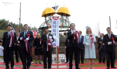
▲개설원을 축하하는 테이프컷을 하고 있는 일영 양국의 내빈

영국 윌리엄왕자가 후쿠시마의 부흥을 기원하며 방문한 모토미야시 공원 내에 「영국정원」이 오픈되었습니다. 11 월 4 일에 열린 개원식에서는 마덴 주일영국대사와 레드 볼릭 전 영국하원의원 등 많은 일영관계자가 참가하여 우호의 다리가 되는 교류거점의 탄생을 축하했습니다.