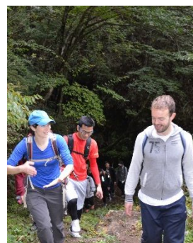
▲外国人灵山登山活动

我在保育园和幼稚园教孩子们用英语唱「闪闪星」, 从幼儿期开始接触外语是一种很好的体验。我喜欢看见孩子们的笑脸。