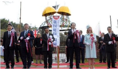
▲正在参加剪彩仪式的日英两国嘉宾

为祈祷福岛的早日复兴,在英国威廉王子访问过的公园里兴建的「英国庭园」正式对外开放,为此11月4号举行了开园仪式。在开园仪式上,马丁·英国驻日本大使、雷迪·波力克元英国下议院议员等日英友好人士一起来庆祝了这个日英友好桥梁的诞生。并且查尔斯王子和威廉王子也发来了贺电,会场始终沉浸在喜庆的气氛之中。