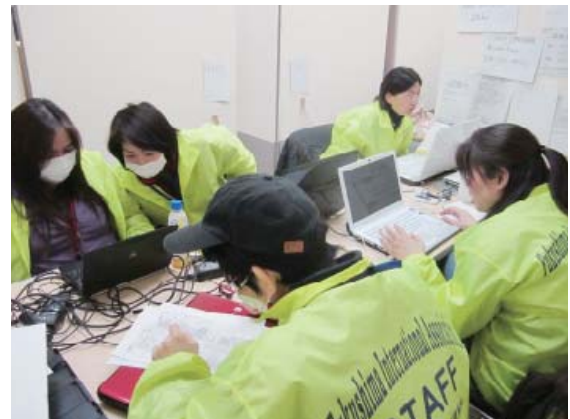
外国語による地震情報センター

(タガログ語、韓国語、ポルトガル語は平成23年5月から毎週第1・2・3水曜日午後)