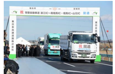
미야기현·야마모토 IC에서 열린 개통식

조우반자동차도는 도쿄도를 기점으로 센다이로 이어지는 고속도로로 1987년부터 이와키시에서 센다이로 연장하는 공사가 진행되고 있었습니다. 소우마-미야기현·야마모토 IC(아터체인지) 간이 2002년에 착공되었지만 동일본 대지진과 도쿄전력 후쿠시마 제 1 원전사고로 건설공사가 일시 중단되었습니다. 그후 복구공사와 건설이 재기되어 올 4월 미나미소우마-소우마 IC 간이 개통되고 12월 6일(토)에 나미에-미나미소우마 IC 간과 소우마-야마모토 IC 간이 개통되었습니다. 이번 개통으로 나미에마치부터 북쪽의 현내 시초우손이 센다이지역과 직결되었습니다. 교통의원만화로 긴급피난도로 기능정비와 현외 관광객의 증가 등 복구·부흥의 가속화가 기대됩니다.