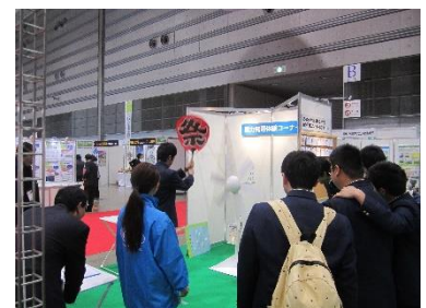
풍력발전 체험하는 고등학생들

12월 3일(수)·4일(목)에 코오리야마시 빅팔레트후쿠시마에서 「후쿠시마 부흥·재생가능에너지산업 페어 2014」가 개최되었습니다. 현내외와 해외의 약 170 기업·단체가 출전해 태양광과 풍력, 지중열, 저에너지 등 재생가능에너지의 최신기술과 연구성과를 전시하고 있습니다. 또한, 정전시 전기자동차로 전기를 공급하거나 비상용 마그네슘공기전지 등 지진재해 교훈을 살린 기술도 소개되어 있어, 방문자들은 다양한 신기술을 둘러보고 있었습니다.