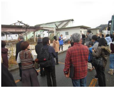
츠나미피해가 그대로인 토미오카역