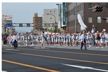
2013 年 6 月在福岛市举行的“东北六魂祭”，吸引了来自全国各地的观光客

受地震及核电站事故影响，重建灾区的生活环境花费了很长的时间，但是随着公共设施的渐渐复原和整顿、医疗和福利设施的重新开放，县内的话题也渐渐明朗起来。对于大米的全袋检查及农作物的放射性物质检查、渔业的现状等福岛县产的农副水产品的状况，以及观光旅游等方面，我们作了详细介绍。另外，县内各地区展开了各种促进复兴的活动。去年 4 月至 6 月的 3 个月，福岛县主办了全国性观光宣传活动、“福岛地域旅游推荐活动（DC）”，观光人数恢复到地震前的 90%。今年 4 月至 6 月将举行“福岛地域旅游推荐后期活动”，期待有更多的观光客来访。