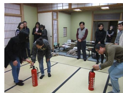
2015 年 1 月举行的“面向外国人的防灾讲座”，讲解了地震的防备措施及灾害发生时的对策

居住于福岛县内的外国人数，在平成 24 年 12 月末曾经减至 9259 人，比地震前减少 15%。之后渐渐恢复，在平成 27 年 6 月末恢复到 10669 人，和地震前相同水平（来自法务省[在留外国人统计]）。来自国外的县内居民，在经历了东日本大地震后，都深切体会到在自然灾害或紧急情况时，与本国朋友进行联络的重要性，因此纷纷自发成立了同乡会等团体，开展各种活动。其中有些团体还在地区公民馆进行传统文化的表演以及开展语言讲座等活动。