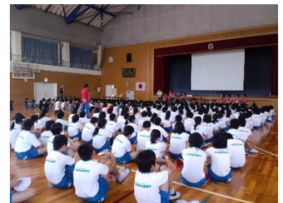
Fukushima- shi Omori Elementary School kuha kasama ang mga estudyante ng ika- 5 • 6 grado ng paaralan

Sponsorado ng Asosasyon ng Fune At Tsubasa Fukushima ay nag tanghal ng 「Ika-anim na beses Yumekikaku Fukushima • Thailand exchange program」 na ginanap noong buwan ng Mayo 29 (Huwebes) hanggang buwan ng Hunyo 1 (Linggo). Umpisa noong taon ng 2007 taon-taon ay ginaganap ang nasabing okasyon, ngunit dahil sa naganap na sakuna sa Fukushima ito ay natigil, at ngayong taon ay muli itong isinagawa. Ngayong taon sampung mga kabataan galing Thailand ang inimitahan, ipinaranas sa kanila ang pag tira sa bahay ng mga Hapones, ang pag-aaral ng wika ng Hapones , ang pakikisalamuha sa mga kabataan ng nasabing lugar. At saka bumisita sila sa Paaralang Elementarya ng Omori sa lunsod ng Fukushima, kung saan nakipagpalitan sila ng kuro-kuro sa wikang Englis sa mga estudyante ng ika- 5 at 6 na grado at nakipag laro. Ang pakikisalamuha ng mga estudyante sa mga kabataan ng Thailand ay tinapos sa pagkanta ng may action song at naging maganda ang dating nito sa mga estudyante ng paaralan.