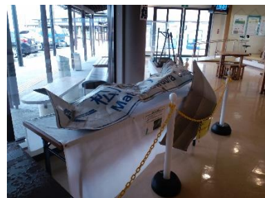
kuha ng nabaluktot na road sign dahil sa tsunami

Sa lunsod ng Soma 「Michi no Eki Soma」 ay naglagay ng lugar para sa disaster information transmission, kung saan ang mga pinagsama-samang litrato at panel noong maganap ang nasabing sakuna at ng matapos maganap sakuna ay naka-paskil. At saka ang mga sinalanta ng tsunami tulad ng road sign ng kalsada, relo, desk, ang kuha ng nabaluklot na bahagi ng tulay, na nailalarawan kung gaano nakasisindak ang nangyari ng lumindo at nagka-tsunami.